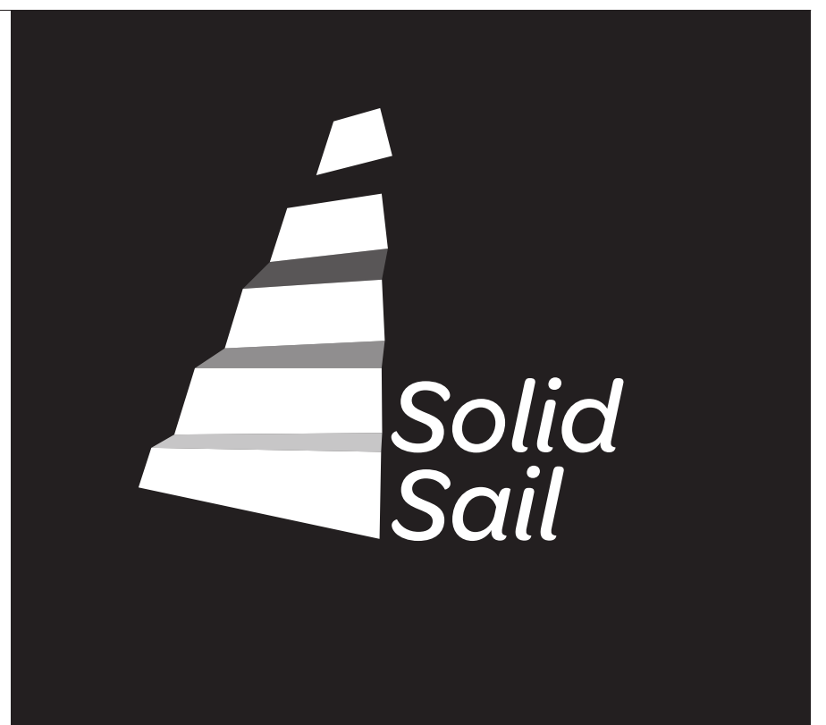
version en réserve blanche