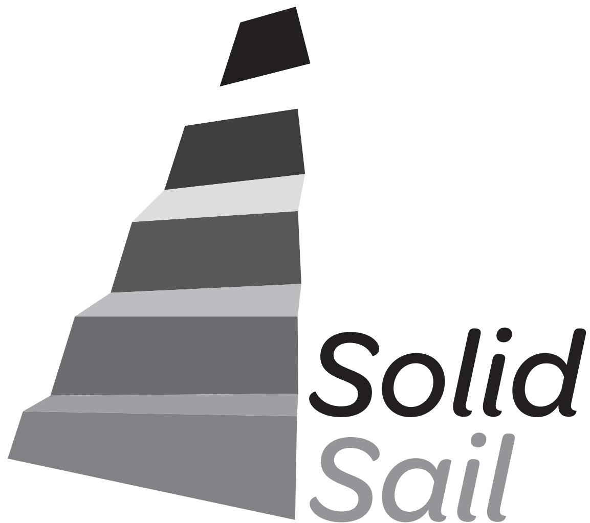
version niveaux de gris